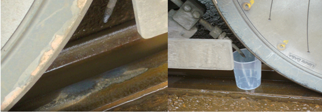
Messung der Sprühmengen auf dem Schienenkopf