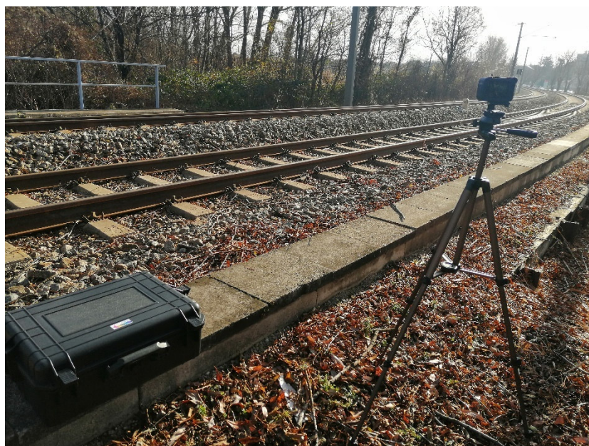
Messgeräte für Geräuschmessung

beginnen bei der Lokalisierung der Geräuschquelle (Schienenkopf / Schienenflanke / welcher Bogen) unter Berücksichtigung und Analyse von vorhandenen Geräten mit objektiver Bewertung.