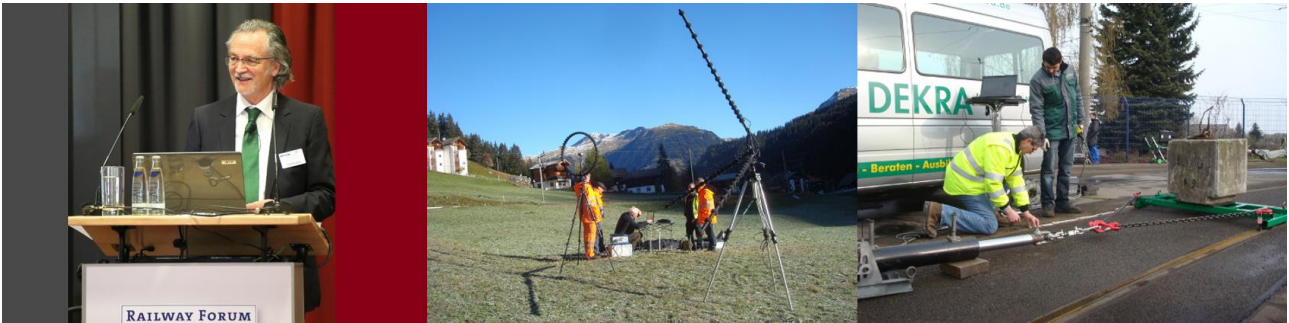
IGRALUB hält Vorträge auf internationalen Eisenbahnforen und Ausstellungen.