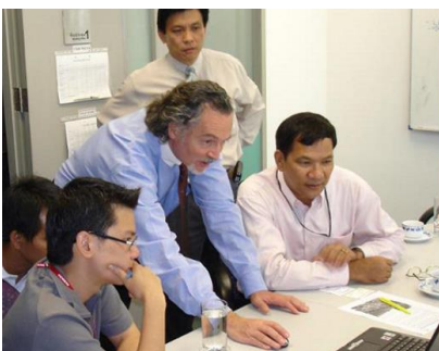
Erstellung eines Nachrüstprogramms mit dem IGRALUB Flottenmanagementsystem.

TOR Control ist eine unabhängige, elektronische Steuerung, welche die zentralen Anforderungen für eine erfolgreiche Schienenschmierung erfüllt: Die richtige Menge zur richtigen Zeit und am richtigen Ort zu schmieren. Das System erkennt die gespeicherten Schmierstellen im Voraus und löst die entsprechende Sprühung aus. Diese wird von einer Vielzahl von Faktoren, wie Fahrtrichtung, Bremsung, Geschwindigkeit, Wetter und der Anzahl Durchfahrten bestimmt.