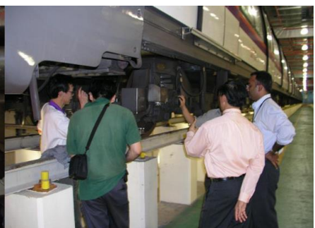
Kundendienst ist sehr wichtig, um die Unterhaltskosten zu reduzieren.