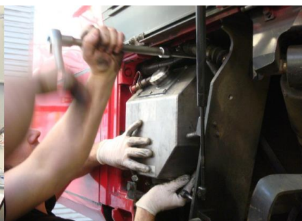
IGRALUB bietet Installationssupport für On-Board-Schmiersysteme.